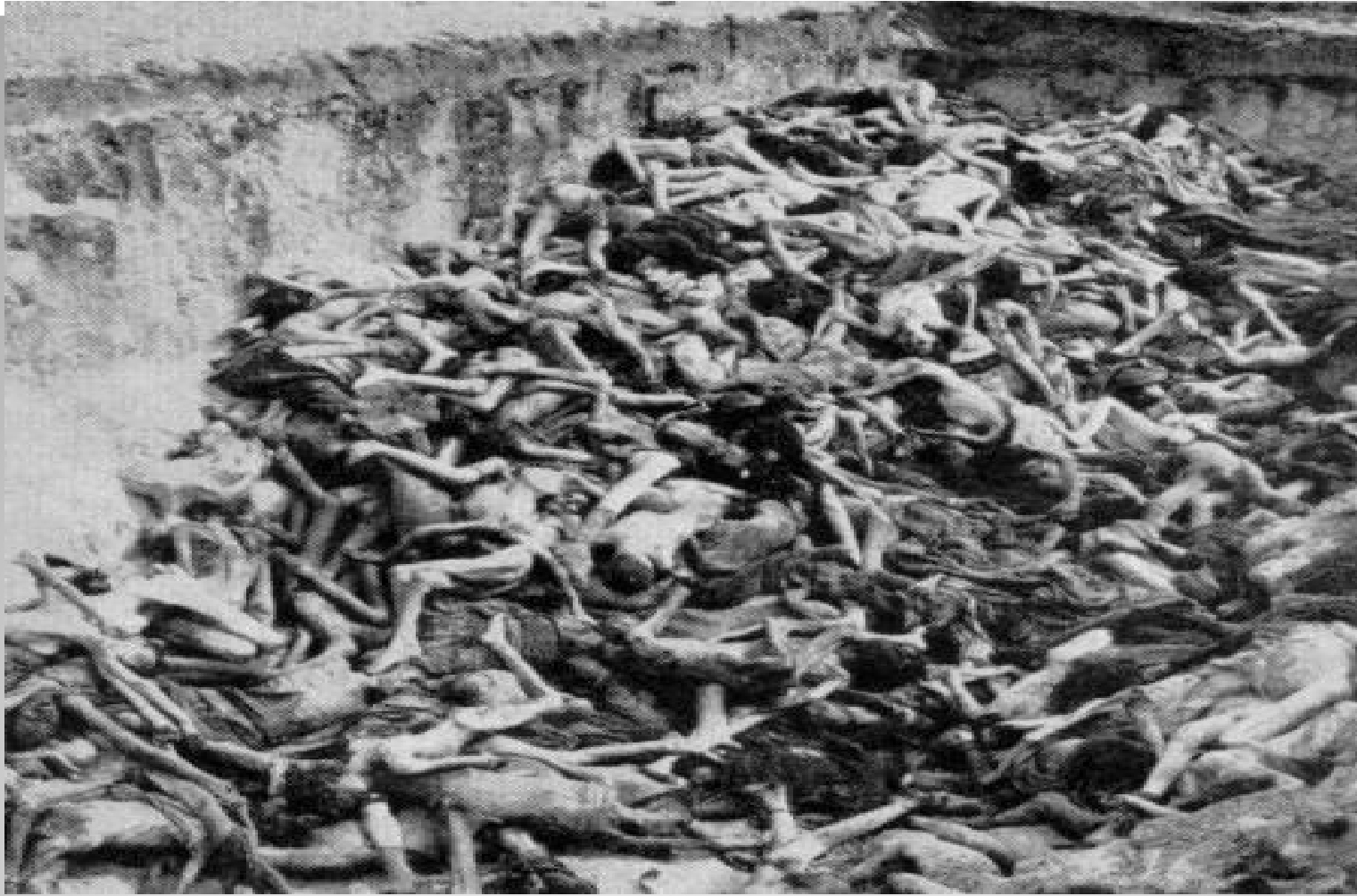
Братская могила умерших от тифа в лагере Берген-Бельзен в конце войны