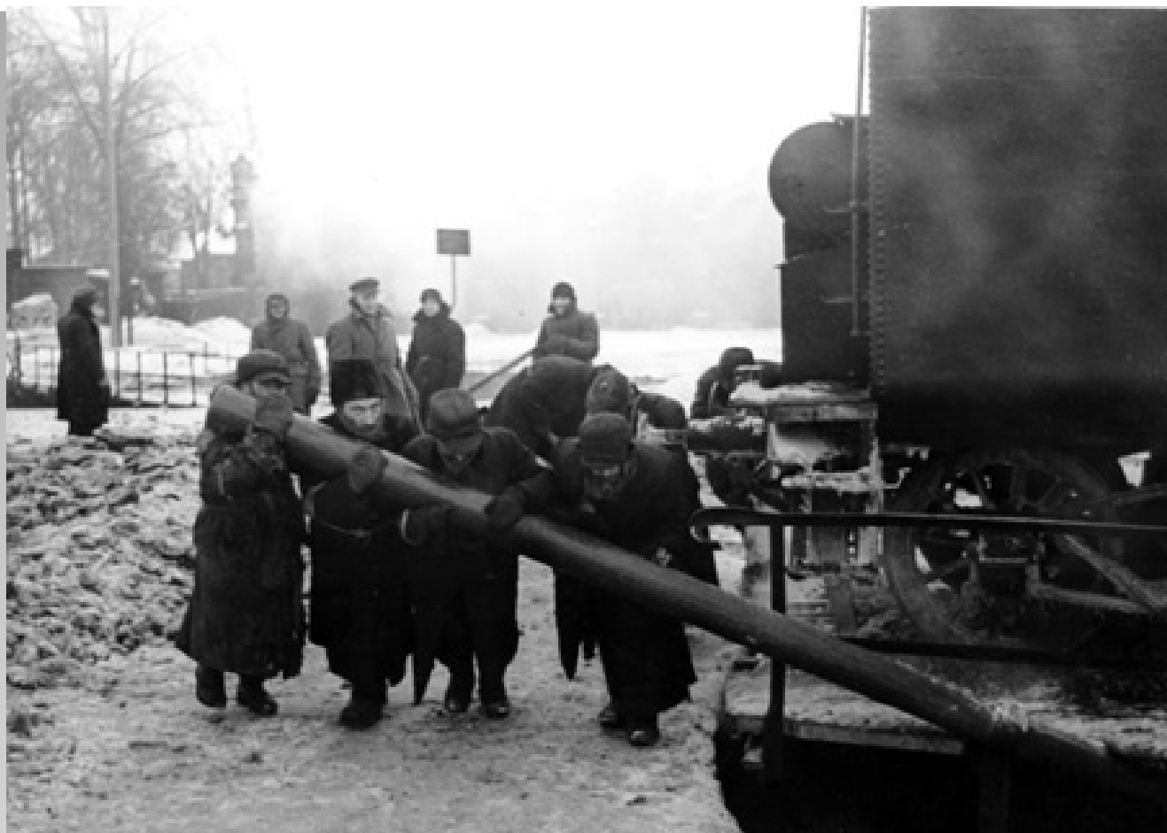
Евреи на принудительных работах в Минске. (период оккупации)